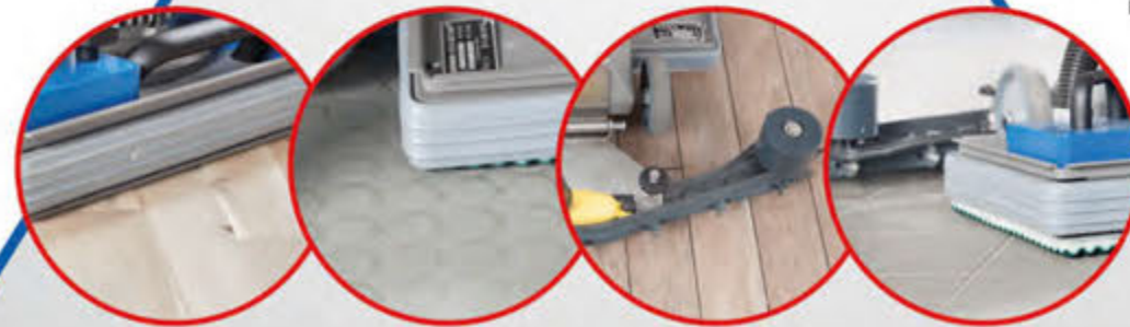
Parkett Noppenboden Hartbeläge Fliesen

Für das Erzielen einer optimalen geölte oder gewachsene Fläche stehen die von uns entwickelten takeit®-Pads zum Einarbeiten, Verteilen oder Aufnehmen überschüssiger Mengen an Öl zur Verfügung.