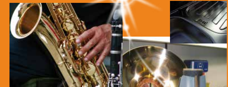
Edelstahl & NE-Metalle